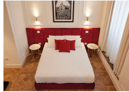
RESIDENZA SANTA MARIA NOVELLA