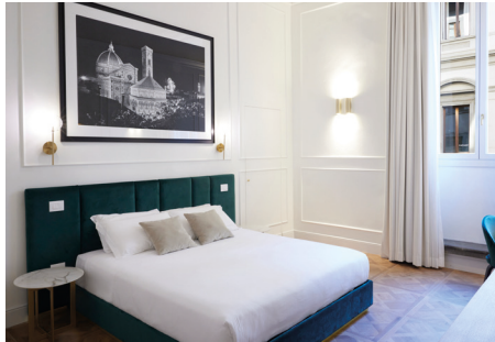
RESIDENZA SAN GIOVANNI