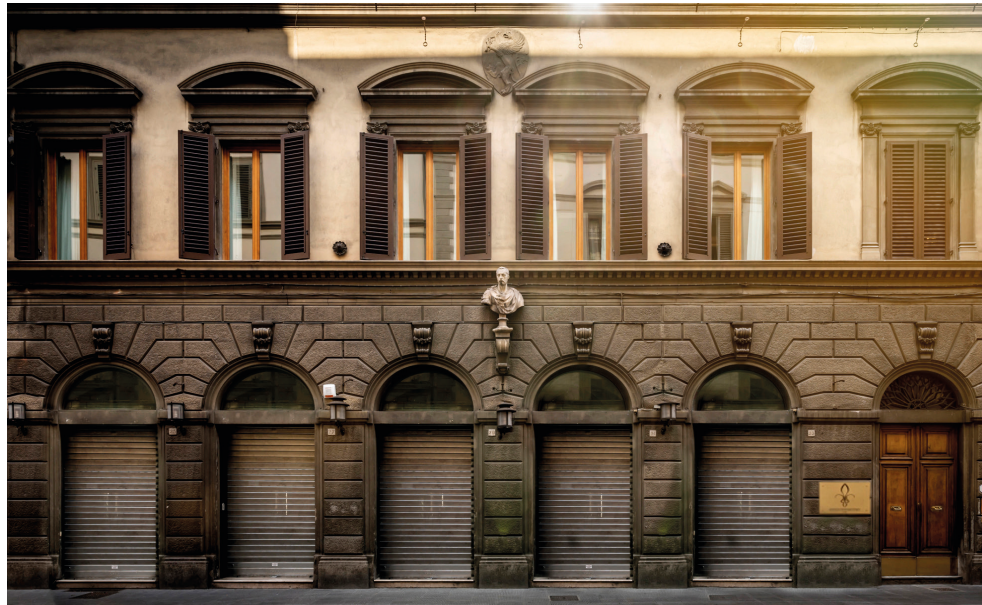
RESIDENZA QUARTIERI STORICI